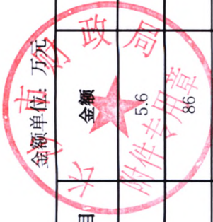
2024年文化和旅游项目资金安排表